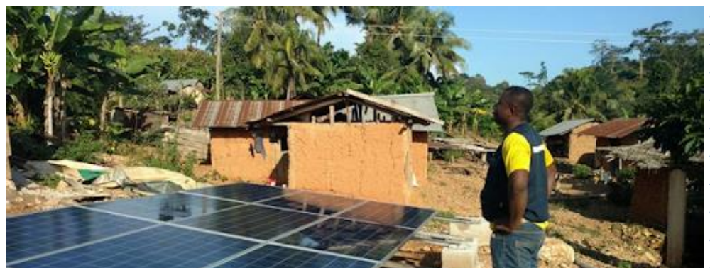
Energicity biedt via haar kleinschalige zonne-energienetwerken Afrikaanse dorpen toegang tot elektriciteit.

De Global Impact Pool heeft in het tweede kwartaal geïnvesteerd in EIF IV. Dit impactfonds heeft in totaal $201 miljoen opgehaald om impactvolle investeringen te doen in naar verwachting rond de 10 tot 15 bedrijven. Tot dusver heeft EIF IV twee investeringen gedaan: Vericool en Energicity. Meer informatie over Vericool vindt u in de Impact Case op pagina 4 van dit kwartaalbericht. Energicity ontwikkelt en installeert kleinschalige electriciteitsnetwerken op zonne-energie om de toegang tot betaalbare en betrouwbare stroom in landelijke en afgelegen gemeenschappen te vergroten.