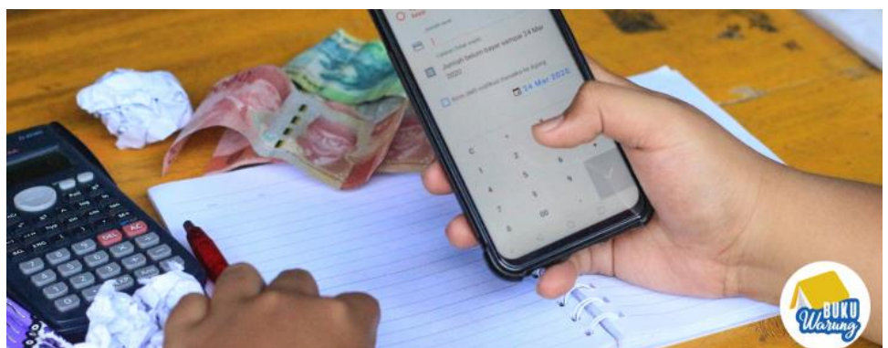
De BukuWarung app helpt kleine ondernemers in Indonesië met hun boekhouding

Twee impactvolle bedrijven zijn dit kwartaal aan de portefeuille toegevoegd: ADDI en BukuWarung. Hiermee komt het totaal aantal portefeuillebedrijven op 12. Om BukuWarung eruit te lichten: dit bedrijf biedt het (micro) MKB in Indonesië een app waarmee zij hun boekhouding op een eenvoudige manier kunnen bijwerken. Indonesië kent 60 miljoen (micro) MKB ondernemingen, vaak ondernemers die zich richten op de verkoop van eten of andere goederen op straat. Met de BukuWarung app wordt vastlegging van bedrijfsinformatie versimpeld. De historie die wordt opgebouwd zorgt ervoor dat deze bedrijven betere toegang krijgen tot financiële diensten. Hiermee wordt verdere groei van hun onderneming gefaciliteerd.